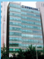
韓国神商株式会社屋外観 (写真のビル7階)