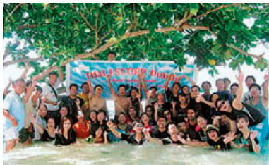
研修旅行 (2010年5月実施 Koh Lanta島)

1126/2 Vanit Bldg., II, Room 2102-3, New Petchburi Rd., Kheang Makkasan, Khaet Rajthevee, Bangkok 10400, Thailand TEL : (+66) 2254-7645