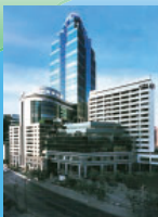
バンコク本店社屋外観 (写真中央のビル21階)